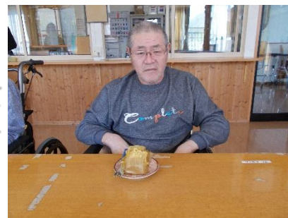
食べるのもったいな