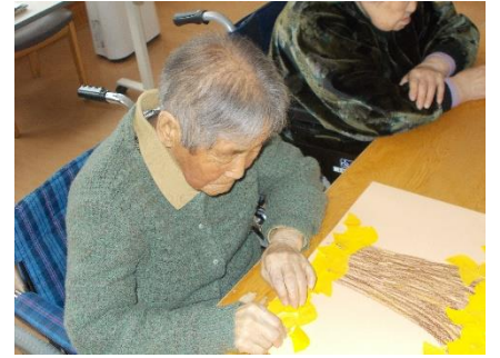
落ち葉がいっぱい落ちてます