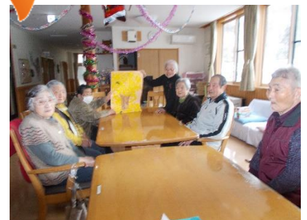
すてきな木になりました