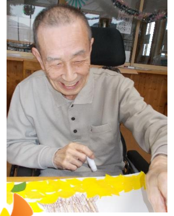
私も負けないわよ