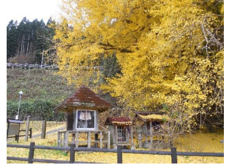
今年も綺麗に色づきました